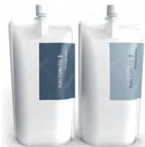
1,2 液 <各 400ml>