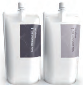
1,2 液 <各 400ml>